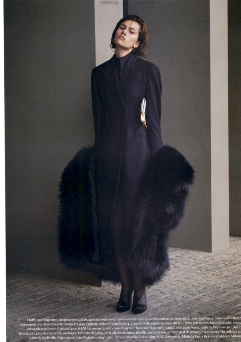
Fluffy coat (899 euro) su spolverino di lana gessata (999 euro), camicia di cotone (169 euro) e cravattino (199 euro), tutto Sportmax, come le décolletées (499 euro); orecchini Louissette Swing di Louis Vuitton, collant Calzedonia (4,50 euro). Nella pagina accanto Blazer e abito con ruches, tutto Givenchy, come i cuissardes; pullover di misto lana, H&M (39,99 euro), orecchini d'argento, bracciale (330 euro) e anelli (160 euro) Fano, tutto Te.Joscrino per DoDo; borraccia 2.4 Bottles (20 euro), orologio DolceVita di Longines (1.380 euro), borsa di pelle, Serpenti Forever East West di Bulgari (1.900 euro). Ha collaborato Gabriele Caciariello. Pettinature Ezio Diaferia using Cotril. Trucco Martina Bolis using MAC Cosmetics. Modella Lucia Bekavac/Fabbrica Milano.