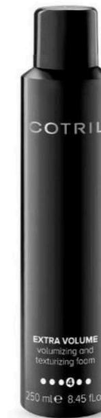
EXTRA VOLUME, ELIMINA L'EFFETTO CRESPO, ISPESSISCE IL CAPELLO E PERMETTE DI REALIZZARE ACCONCIATURE MOSSE