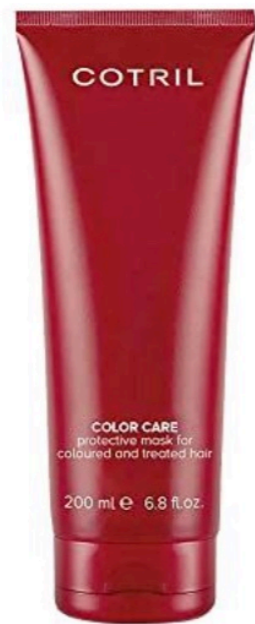
COTRIL COLOR CARE MASK, 200 ML