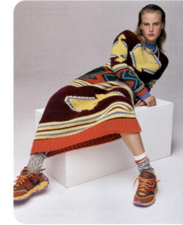
116 Fil rouge