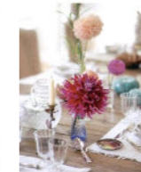
160 Il re delle date