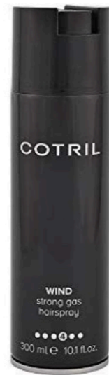
WIND STRONG GAS HAIRSPRAY, 300 ML