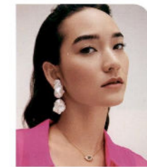
138 Make up flessibile