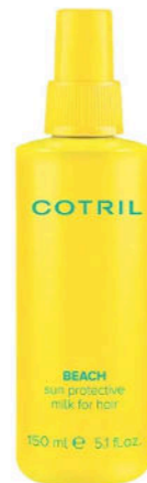
Beach Milk, Cotril

Beach Milk, Cotril: il latte solare protettivo per capelli che non appesantisce i capelli