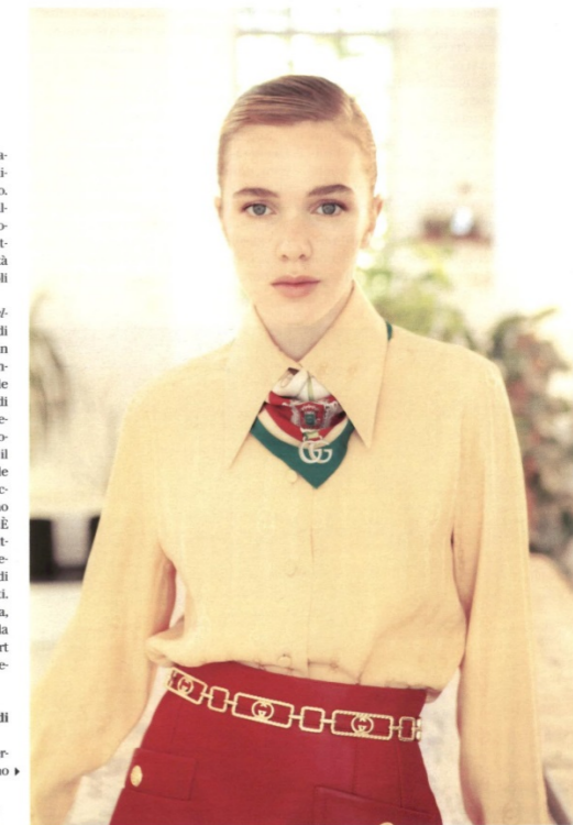
Styling: Diletta Pecchia - Hair/Makeup: Valeria Jovino per Cotril

«Faccio fatica a portare me stessa in scena perché non riesco a definirmi. Come dire, ci sono ▶