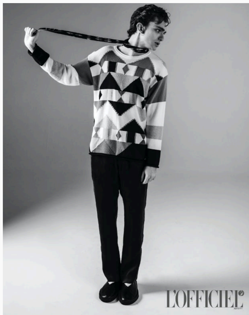
Pull, cravatta, pantaloni e scarpe, GIORGIO ARMANI