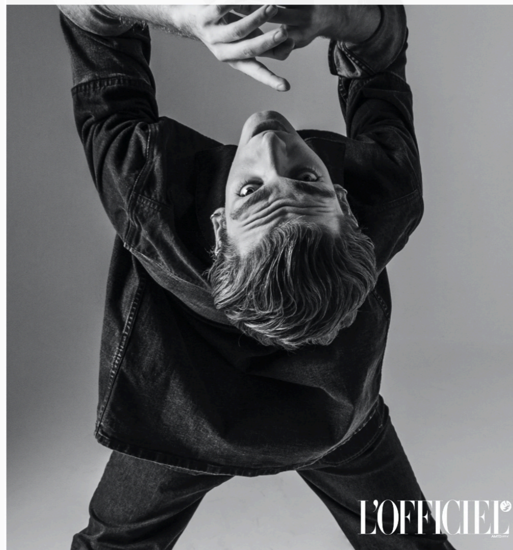
Camicia e pantaloni, PAUL SMITH